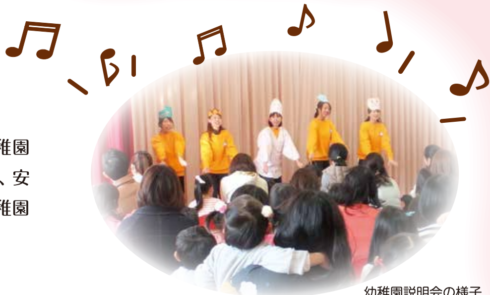
幼稚園説明会の様子

大切なお子様の入園にあたり、清泉幼稚園は、どのような教育をすところかを理解し、安心して入園して頂ける様、下記の通り、幼稚園説明会を行います。